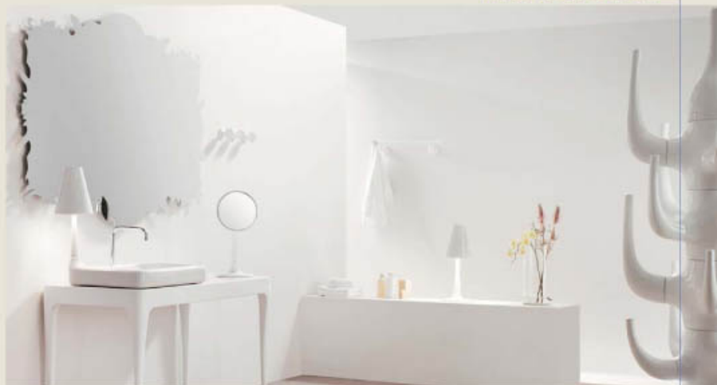
Cuarto de baño de Jaime Hayon para ArtQuitect.

Los ambientes domésticos serás más elegantes, sorprendentes y escénicos.